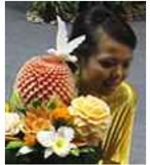
Título de la foto: Estudiantes tailandeses mostrando el antiguo arte de esculturas de alimentos en la XIX ICN. ¿Podría ser esta una forma de estimular a las personas a comer más frutas y verduras?