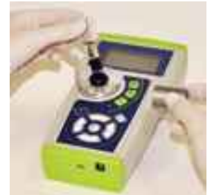
Midiendo el contenido de micronutrientes con el espectrofluorofotómetro iCheck™ T3 (imagen de abajo); el kit completo en su conveniente caja para el transporte (imagen de arriba)

Simone K. Frey, BioAnalyt GmbH, Teltow, Germany ( simone.frey@bioanalyt.com )